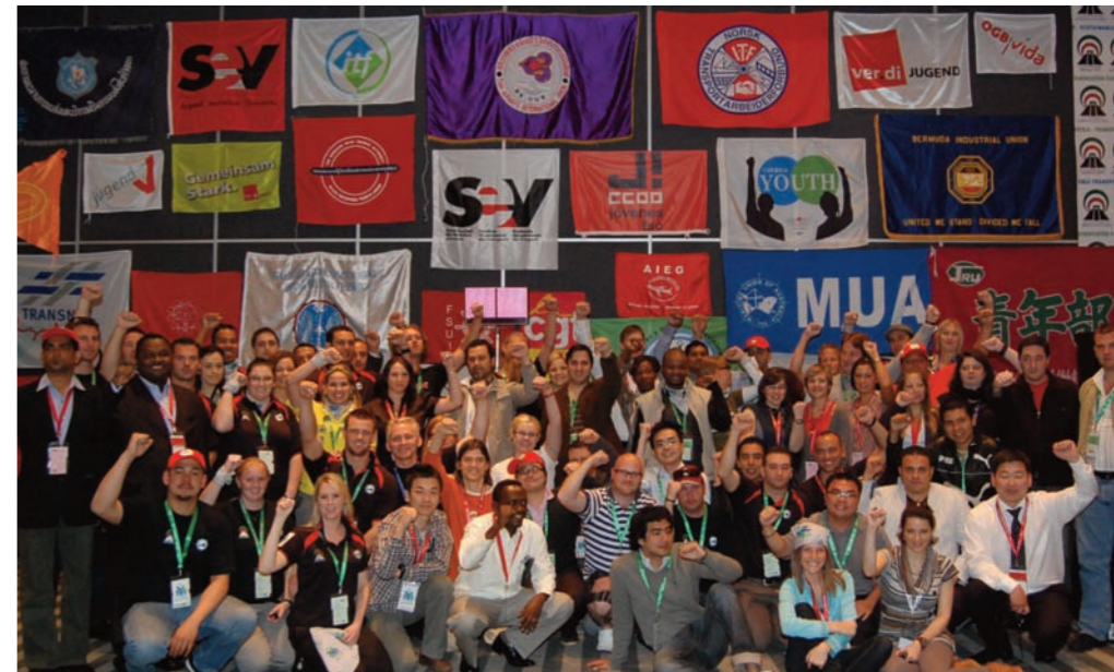
Delegados y delegadas en la Conferencia de la juventud trabajadora en Ciudad de México: Véase página 3.