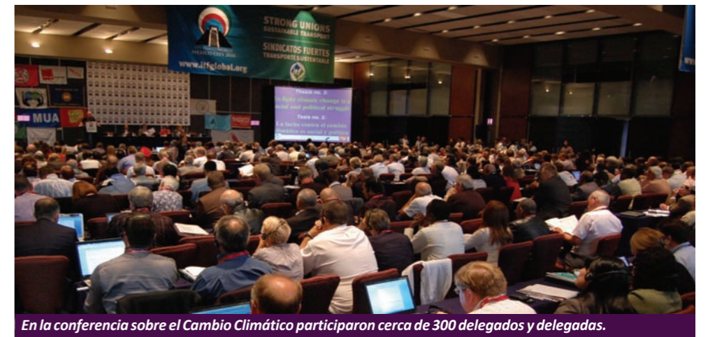
En la conferencia sobre el Cambio Climático participaron cerca de 300 delegados y delegadas.