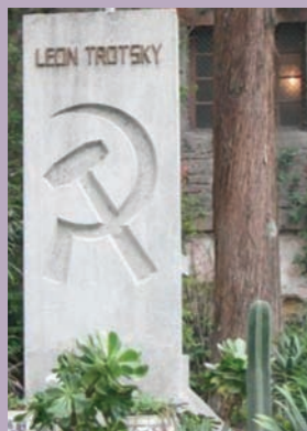
Lápida de Leon Trotsky en la Casa Museo Trotsky.

70 El 20 de agosto se conmemora el asesinato del dirigente comunista León Trotsky en el Distrito Federal, a manos de un agente secreto soviético. La casa de Trotsky en Coyoacán (Río Churabasco 410) se ha convertido en un museo, situado a pocas cuadras de la casa de la artista Frida Kahlo, también convertida hoy en museo (Londres 247). El dirigente soviético vivió en casa de Kahlo hasta que riñó con ella y su compañero, el pintor Diego Rivera.