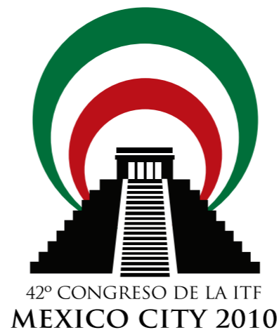
42º CONGRESO DE LA ITF MEXICO CITY 2010

Resumiendo la sesión, Cockroft declaró: "Éste es el mensaje que enviamos a las empresas globales: los sindicatos de la ITF están aquí para quedarse. No tienen dónde esconderse. Las compañías no pueden eludir la normativa social traspasando las fronteras, porque los sindicatos de la ITF ¡contraatacarán!".