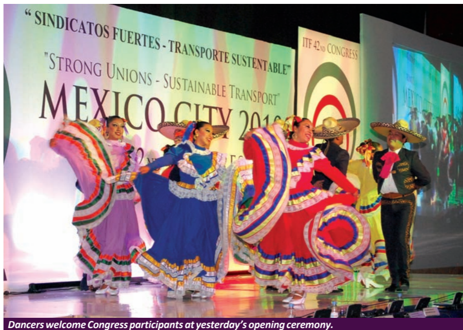
Dancers welcome Congress participants at yesterday's opening ceremony.