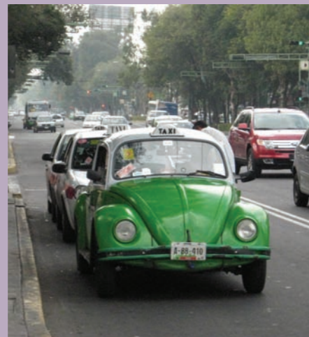
Fabricado en México: Un taxi escarabajo Volkswagen "vocho". Ver cifra "21.529.464"

92 La semana de trabajo de una mujer mexicana, incluidas las 54 horas de trabajo en casa, es de una media de 92 horas. La de un